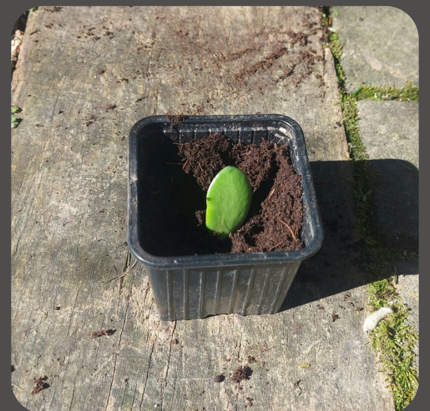
Mettre la base de la feuille dans un pot sans tassé le terreau