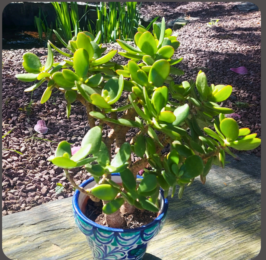
Nom : Crassula ovata