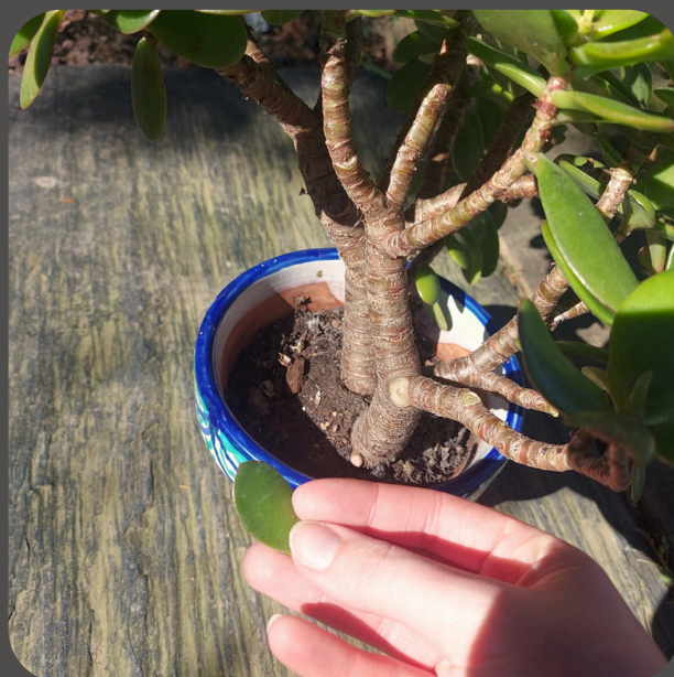
Récupérer ou couper une feuille