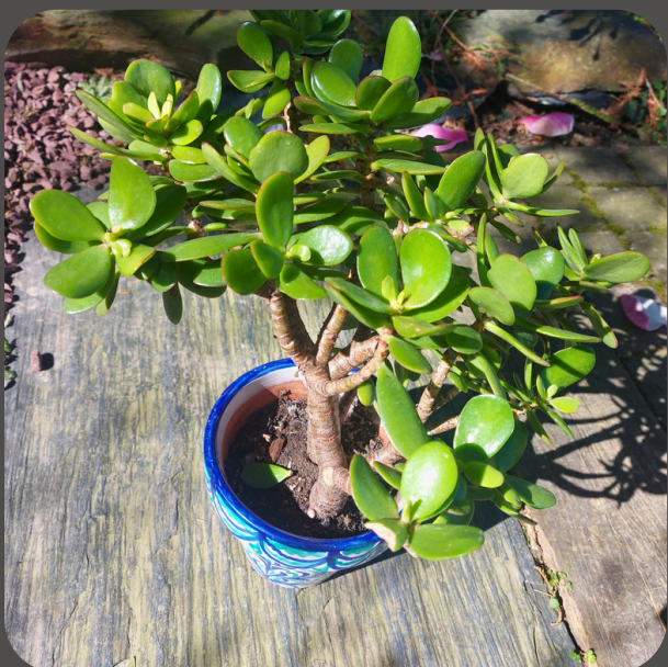
Plant de Crassula